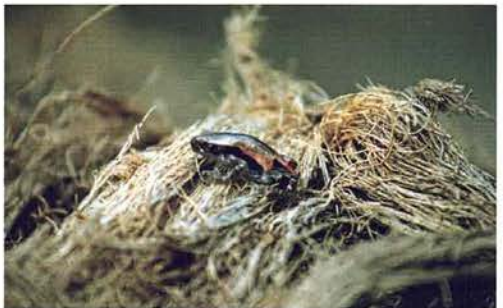
Abb. 21. Phrynomantis microps , Männchen.