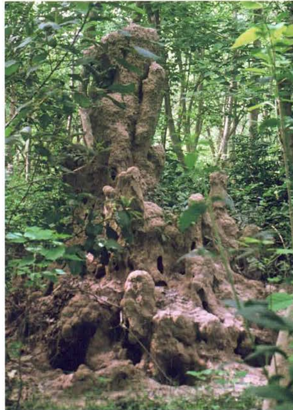
Abb. 23. Großer Termitenbau im Abuko-Nationalpark, Gambia.

Was kann man in der Regenzeit denn sonst noch finden? Sind auch Königspythons unterwegs? Ein paar Lurche kann man schon noch entdecken. Im Abuko-Nationalpark in