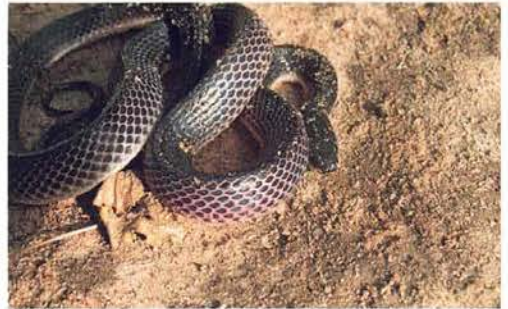
Abb. 97. Gonionotophis granti .