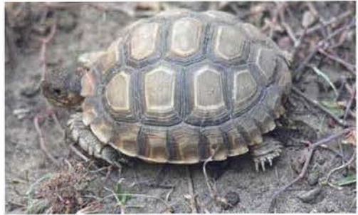
Abb. 76. Centrochelys sulcata .