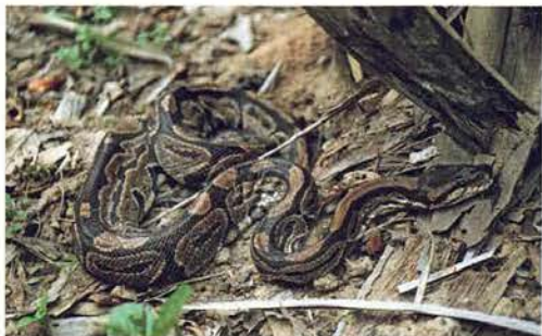
Abb. 72. Königspython, Python regius .