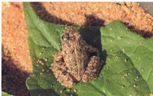
Abb. 41. Phrynobatrachus latifrons .