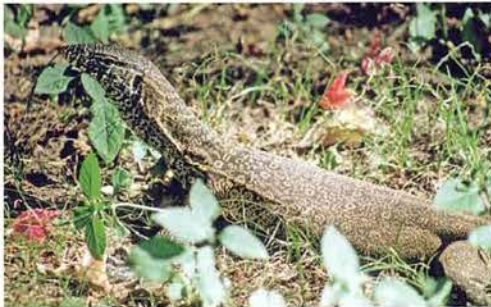
Abb. 3. Varanus niloticus .