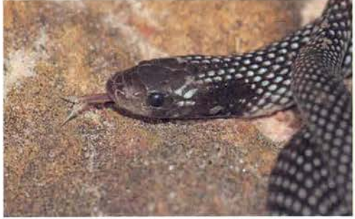
Abb. 30. Prosymna greigerti greigerti .