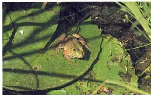
Abb. 16. Hoplobatrachus occipitalis .