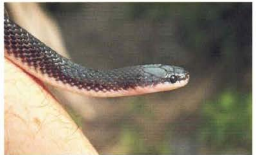
Abb. 98. Gonionotophis granti , Porträt.