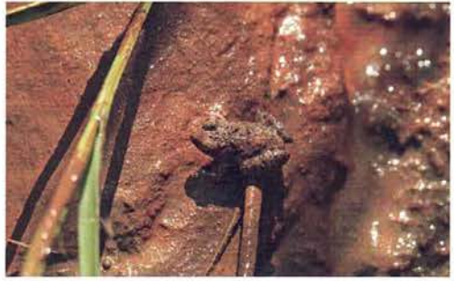
Abb. 18. Phrynobatrachus calcaratus .

Regenfälle zwingen auch Schlangen an die Oberfläche, die sonst im Verborgenen im Bodengrund leben. Genannt seien hier Afrotrophlops punctatus (Abb. 26 & 27), Prosymna meleagris laurenti (Abb. 28 & 29) und Prosymna greigerti greigerti (Abb. 30), allesamt gesammelt in der Feuchtsavanne bei Karton im Südwesten Gambias. Solch kleine Schlangen laufen, wenn sie einmal an der Erdoberfläche sind, allerdings schnell Gefahr, von großen Fröschen wie Hildebrandtia ornata (Abb. 31) als Beute ausgemacht zu werden. Aber