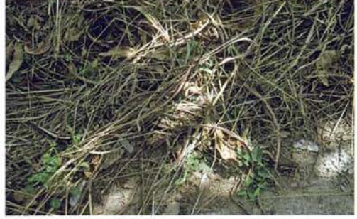
Abb. 86. Python regius .