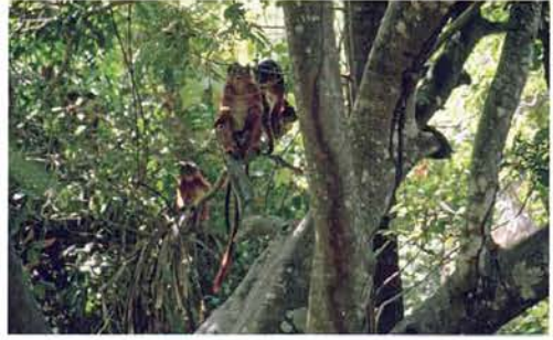
Abb. 6. Rote Colobusaffen im Bijilo-Forest, Gambia.

Im Küstentrockenwald fanden wir neben den Skinken Trachylepis perrotetii (Abb. 10) und Trachylepis affinis (Abb. 11) auch eine Westliche Sandboa ( Eryx muelleri ; Abb. 12 & 13). Diese Art hätten wir eher in trockeneren Gefilden im Senegal vermutet, wo wir sie aber nie nachweisen konnten. Im Gestrüch des Waldes konnten wir ein Senegalchamäleon ( Chamaeleo senegalensis ; Abb. 14) aufstöbern, das sich aber umgehend in dichteres Gestrüpp zurückzog. Das restliche Tierleben