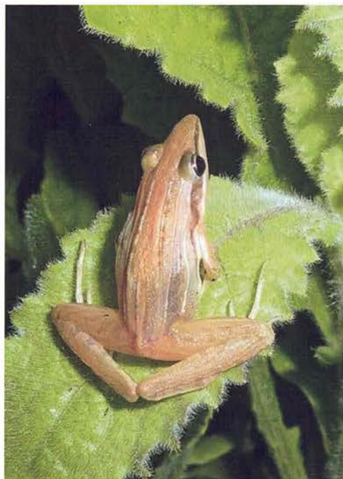
Abb. 80. Ptychadena tournieri .