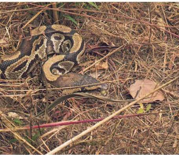
Abb. 1. Königspython, Porträt, Python regius .

Im Folgenden werden die Begegnungen mit Königspythons während zahlreicher Forschungsreisen nach Westafrika, speziell nach Gambia und in den Senegal, zu allen Jahreszeiten und in verschiedenen Biotopen geschildert.