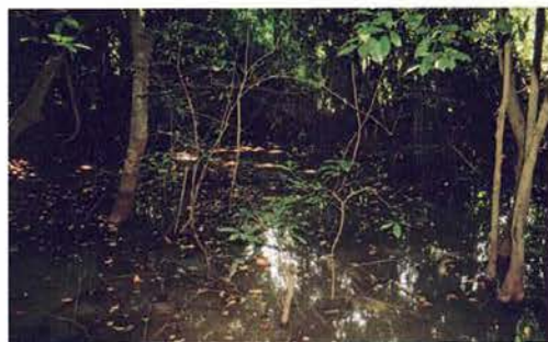
Abb. 46. Abuko unter Wasser.