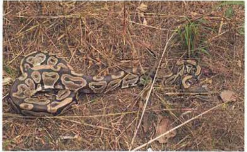
Abb. 8. Königspython, Python regius .