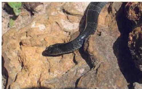
Abb. 34. Elapsoidea semiannulata moebiusi .