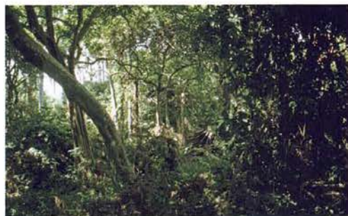
Abb. 45. Abuko zur Regenzeit.