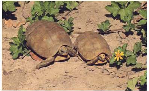
Abb. 54. Kinixys nogueyi .