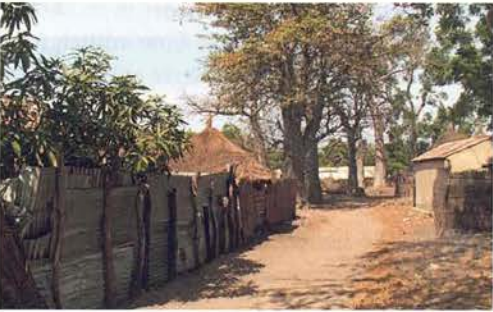
Abb. 50. Dorf von Erdnussbauern.