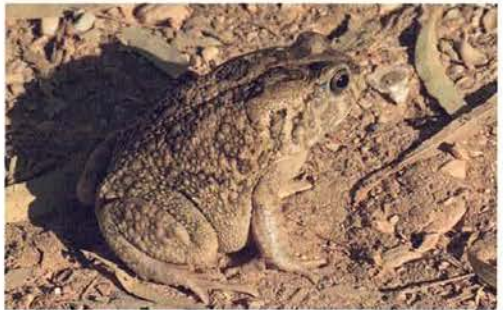
Abb. 20. Amietophrynus regularis .