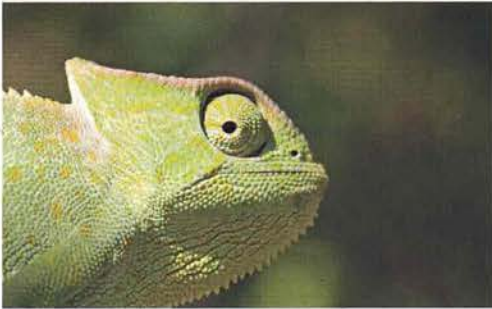
Abb. 92. Chamaeleo senegalensis .