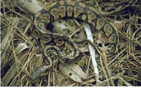
Abb. 24. Juveniler Königspython, Python regius .