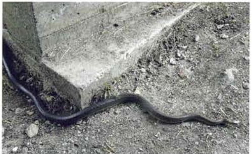
Abb. 4. Eine junge Äskulapnatter in der Nähe des Schutzgebietes.