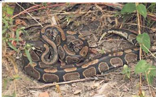
Abb. 71. Königspython, Python regius .