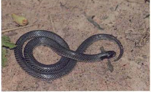
Abb. 29. Prosymna meleagris laurenti , juvenil.