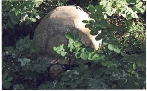
Abb. 75. Centrochelys sulcata .

Als wir am nächsten Morgen zum Frühstück in den Salon kamen, fanden wir zu unserer Verwunderung diesen völlig menschenleer vor. Wir fanden die versammelte Mannschaft