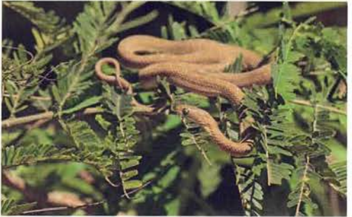
Abb. 60. Dasypeltis gansi .