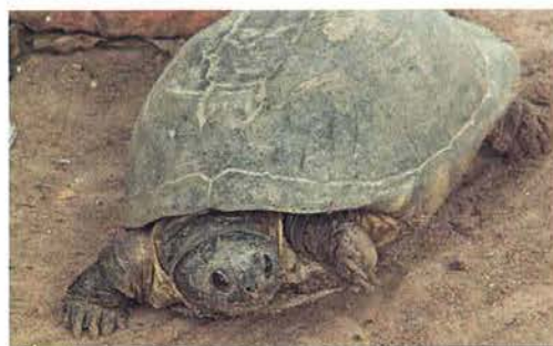
Abb. 47. Pelusios castaneus .

Makasutu Wildlife Trust über die Amphibien und Reptilien Gambias. Dort stand aber auch, dass es sich bei den grünen „Reisfeld-Mambas“ um harmlose Buschnattern handelt. Trotz vorhandener Fachliteratur ließ sich der Mann von seiner Meinung aber nicht abbringen.