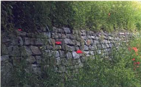
Abb. 2. Steinmauern sind ein bevorzugter Rückzugsort von Schlangen, da sie Wärme speichern.