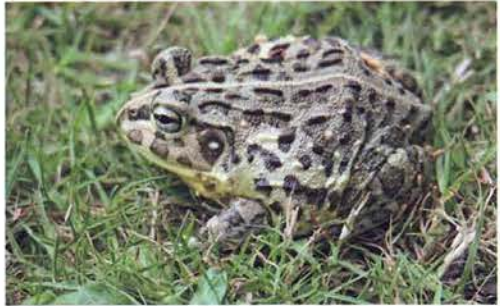
Abb. 31. Hildebrandtia ornata .