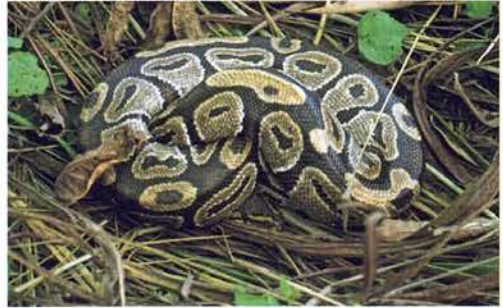
Abb. 88. Python regius ..