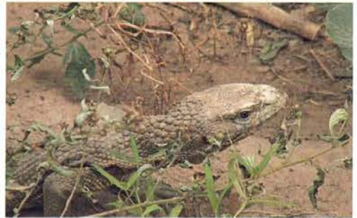
Abb. 53. Varanus exanthematicus , Porträt.