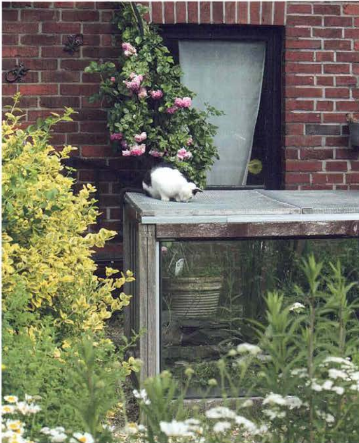
Abb. 6. Ob sich die Katze für den Fisch oder für die Schlangen interessierte, ließ sich nicht abschließend klären.

Händler in der Umgebung mit 2,99 € exorbitant hoch war, musste ich mich auf Dauer nach Alternativen umsehen. Dabei kam der Zufall ins Spiel: Ich erfuhr von einem Freund, dass sein Schwager Inhaber eines Angelgeschäftes sei. Also fuhren wir gemeinsam zu ihm. Er bot mir an, dass ich Grau- bzw. Silberorfen, die er als Köderfische anbietet, von ihm zum Einkaufspreis bekommen könnte, sofern die Schlange diese