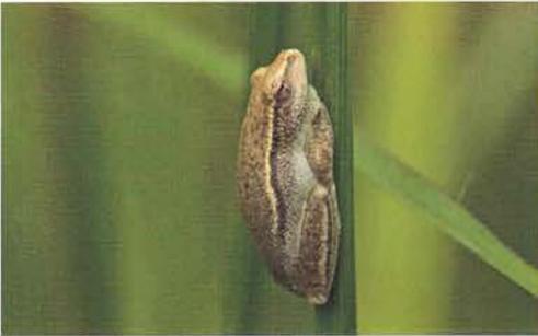
Abb. 83. Leptopelis viridis .