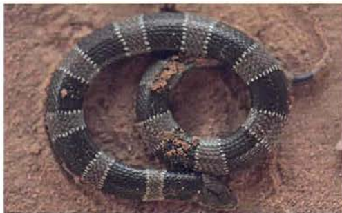
Abb. 36. Jungtier von Elapsoidea semiannulata moebiusi .