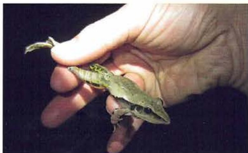
Abb. 81. Ptychadena longirostris .

und andere Gäste dann in heller Aufregung im Garten um einen Busch versammelt. Dort drin hockte eine riesige Spornschildkröte und zupfte genüsslich Blätter vom Strauch, um sich diese einzuverleiben (Abb. 75). Innerhalb der Hotelumzäunung war es grün, da alle Pflanzen in den täglichen Genuss frischen Wassers kamen. Außerhalb des Zaunes war es in der Trockenheit natürlich, nun ja, bauchwindtrocken. Die Schildkröte unterwanderte in ihrer subversiven Art und mittels Masse den Drahtzaun einfach. Das Untier, das mit solch einer Kraft sicherlich auch Kleinkinder platt machen könnte, wurde von den Gärtnern in eine Schubkarre gepackt und in die trockene Natur zurückverfrachtet. Dort konnten wir nach dem verspäteten Frühstück auch noch ein Jungtier vom Vorjahr sichten (Abb. 76), bevor wir die Rückreise nach Gambia antraten.