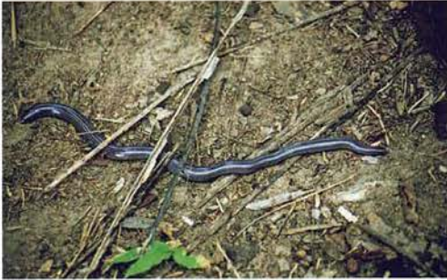
Abb. 26. Afrotrophlops punctatus .