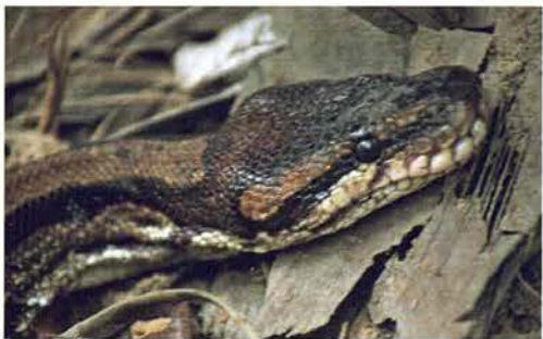
Abb. 73. Königspython ( Python regius ), Porträt.