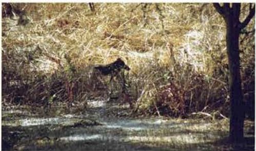
Abb. 74. Warzenschwein im Reservat Siné-Saloum.