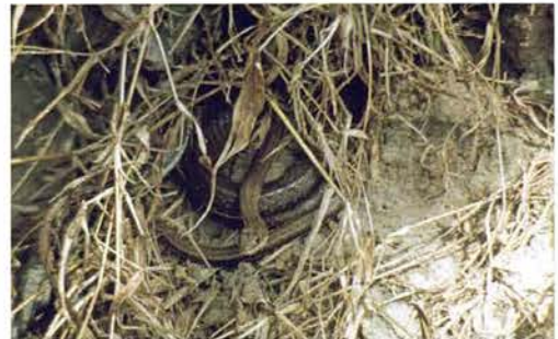
Abb. 65. Psammophis sibilans .