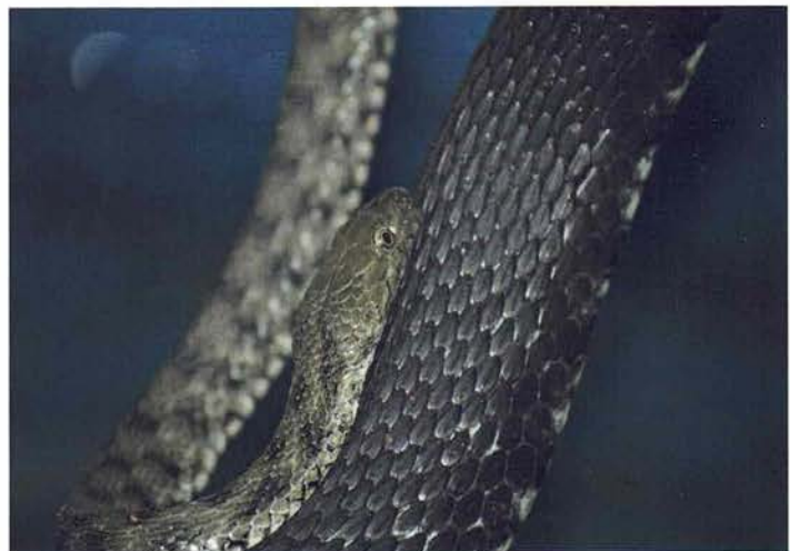
Abb. 5. Männliche Würfelnattern bleiben deutlich kleiner als die Weibchen.

Mitteleuropäische Würfelnattern sind fast reine Fischfresser. Das Nahrungsspektrum umfasst Fische verschiedener Arten (z. B. Hasel, Gründling, Barsch, Karpfen, Barbe), wobei die Zusammensetzung je nach Standortangebot stark variiert. Im Süden und Osten des Verbreitungsgebietes wird allerdings auch von Würfelnatter-Populationen