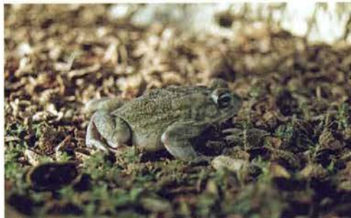
Abb. 70. Amietophrynus xeros .

Es ward Nachmittag und wir verteilten uns wieder im Gelände. Beim Wenden von Steinen und Ästen kam eine Katzennatter ( Telescopus variegatus ) zum Vorschein (Abb. 58 & 59). Im Geäst von Akaziensträuchern fanden wir zwei Eierschlangen ( Dasypeltis gansi ). Eine weitere verbarg sich in einem Busch (Abb. 60–62).