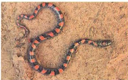
Abb. 43. Jungtier von Lycophidion albomaculatum .