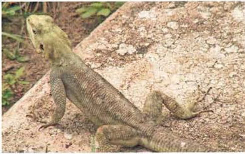
Abb. 2. Agama agama .