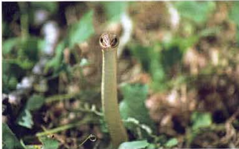
Abb. 68. Psammophis sibilans , Porträt.