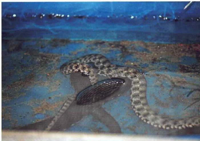
Abb. 10. Paarung im Wasser.

aufnahme, und kurz darauf sind bereits die ersten Paarungsaktivitäten zu beobachten.