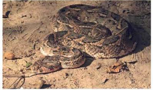
Abb. 95. Bitis arietans arietans .