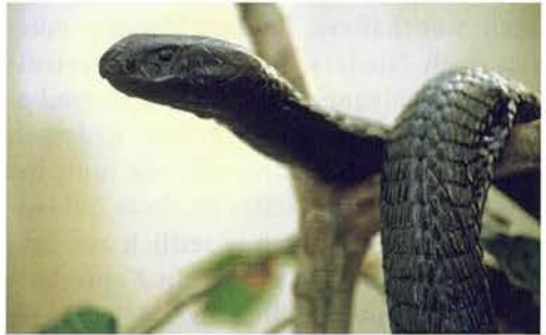
Abb. 19. Naja nigricollis .