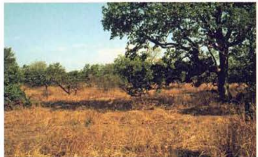
Abb. 90. Feuchtsavanne bei Kartong, Gambia.