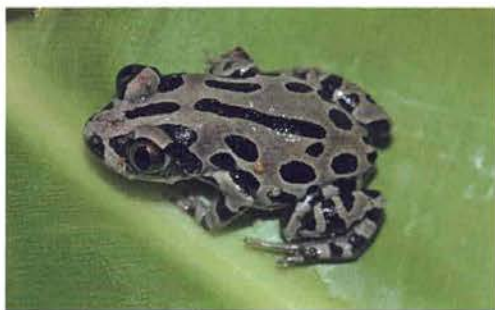
Abb. 40. Kassina senegalensis .