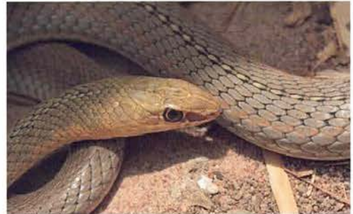
Abb. 64. Psammophis lineatus , Porträt.