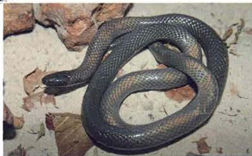
Abb. 32. Amblyodipsas unicolor .