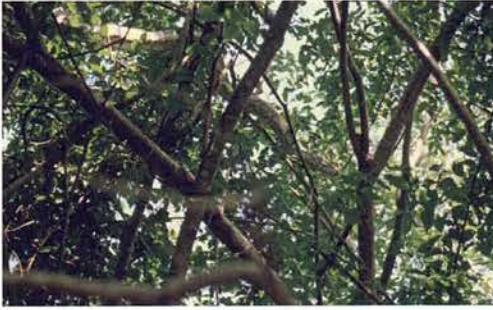
Abb. 56. Python sebae .

auf mich in der Hoffnung, dass ich mich im Katastrophenfall an die zur Studienzeit erworbenen Fertigkeiten als Rettungsschwimmer erinnern könnte. Auch meine