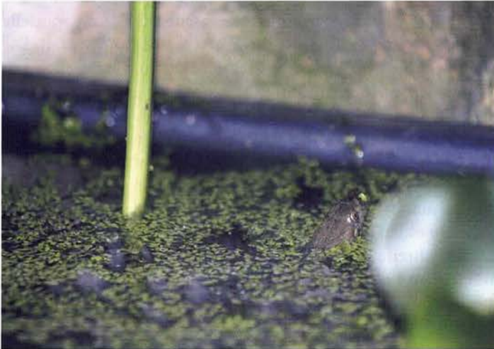
Abb. 2. Das große Wasserbecken wird von den Würfelnattern häufig zum Schwimmen genutzt.

Wie eingangs erwähnt, sind meine Würfelnattern im Zimmerterrarium sehr neugierig und nicht scheu. Bei Reinigungsarbeiten bleiben sie an ihren Plätzen liegen und schauen zu, was ich da so im Terrarium veranlasse. Bei Fütterungen kommen sie mir sogar entgegen und nehmen tote Fische von der Pinzette an. Dieses Verhalten ändert sich jedes Jahr genau an jenem Tag, an dem sie in das Freilandterrarium überführt werden. Unterschreite ich eine Distanz von vier bis fünf Metern, fliehen die Schlangen mit enormer Geschwindigkeit, zumeist auf direktem