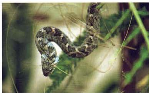
Abb. 100. Dasypeltis confusa .

Fortsetzung des Artikels in ophidia 1-2018.