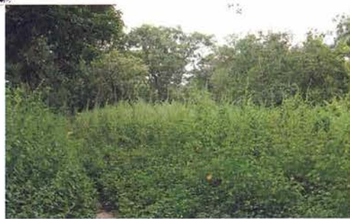
Abb. 44. Regenzeit – die Vegetation „schießt ins Kraut“.