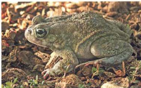
Abb. 5. Amietophrynus maculatus .

Wir landeten üblicherweise auf dem Flughafen Banjul in Gambia und nahmen Quartier in kleinen Hotels bei Kotu oder Bakao. Von dort aus starteten dann alle weiteren Streifzüge durch Gambia und den Senegal.