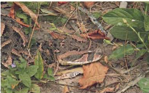
Abb. 94. Bitis arietans arietans .