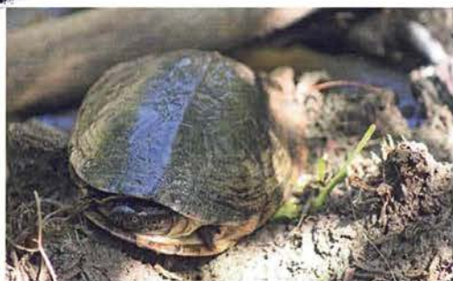
Abb. 79. Pelusios adansonii .