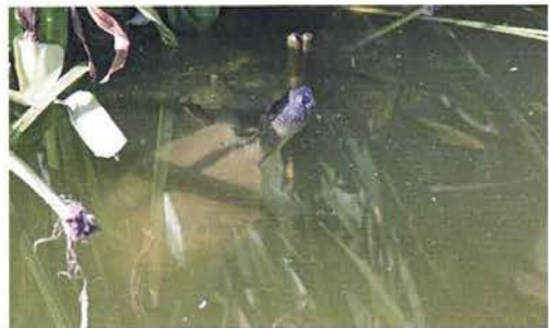
Abb. 78. Pelusios adansonii .