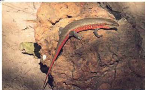
Abb. 10. Trachylepis perrotetii .