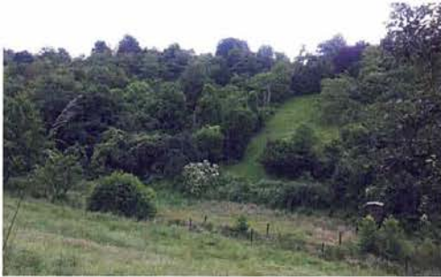
Abb. 1. Der vielfältige Lebensraum der Äskulapnatter.

Das milde Klima im Rheingau sorgte dafür, dass sich in einem Tal bei Frauenstein eine Population der Äskulapnattern erhalten konnte. Hier findet sie zudem einen idealen Lebensraum vor: abwechslungsreiche, kleinteilige Landschaft mit Plätzen, die Deckung und aus-