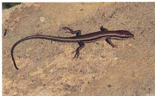
Abb. 11. Trachylepis affinis .