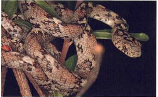
Abb. 59. Telescopus variegatus .