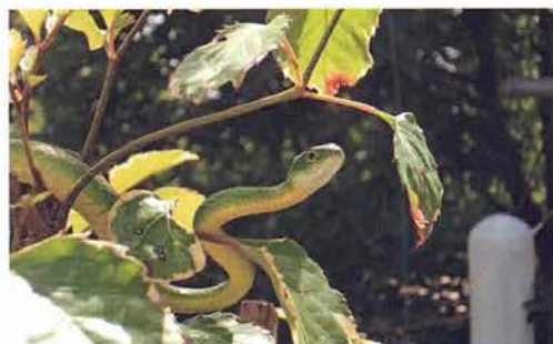
Abb. 103. Philothamnus irregularis .