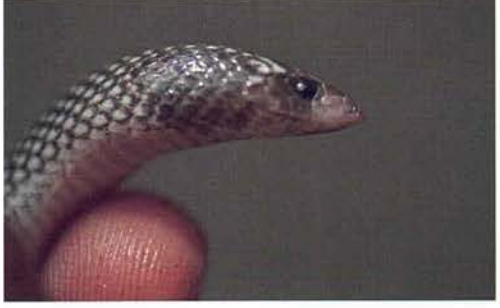
Abb. 28. Prosymna meleagris laurenti , Porträt.