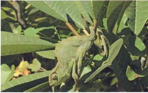
Abb. 91. Chamaeleo senegalensis .