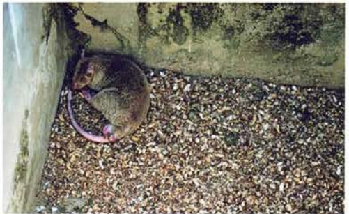
Abb. 9. Riesenhamsterratte, Cricetomys gambianus .