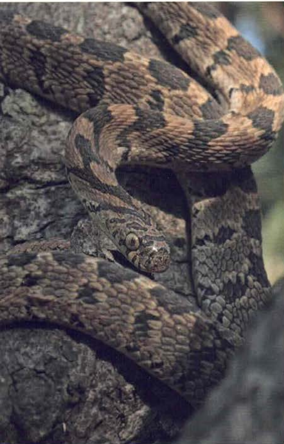
Abb. 57. Dasypeltis sahelensis .

auf mich in der Hoffnung, dass ich mich im Katastrophenfall an die zur Studienzeit erworbenen Fertigkeiten als Rettungsschwimmer erinnern könnte. Auch meine