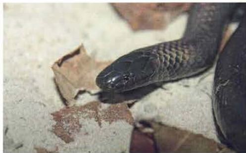
Abb. 33. Amblyodipsas unicolor , Porträt.