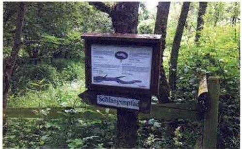
Abb. 3. Die Region um das Schutzgebiet ist traditionell mit Schlangen sehr verbunden.