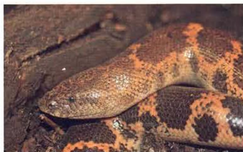
Abb. 13. Porträt einer Eryx muelleri .