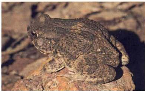
Abb. 38. Kurzschnauzenkröte, Sclerophrys pentoni .