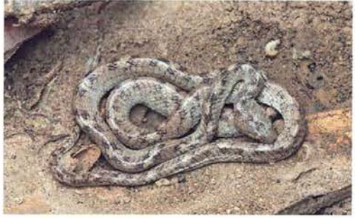
Abb. 58. Telescopus variegatus .

Das nicht mehr vernehmbare Klappern des Küchengeschirrs war denn das sichere Zeichen für Fahrer und Guide, die Gefährten wieder einzuladen und die Reise fortzusetzen. Nach einiger Zeit ermüdenden Dahintuckern mit wohlgefüllten Bäuchen legte unser Fahrer plötzlich eine Vollbremsung hin. Was war passiert, Stau in der Prärie? Ein Blick über die Motorhaube offenbarte uns ohne Umschwei-