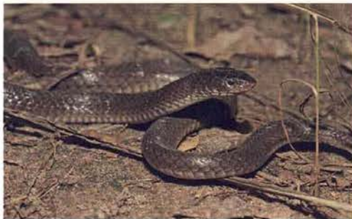
Abb. 37. Elapsoidea trapei , Porträt.