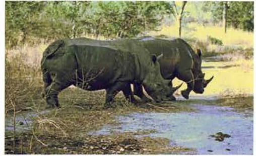
Abb. 52. Breitmaulnashörner.