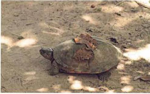
Abb. 48. Pelusios castaneus .