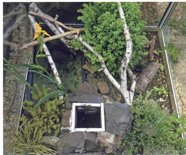
Abb. 1. Das Freilandterrarium; Ansicht von oben.

Für die Einrichtung des Freilandterrariums habe ich mich durch In-situ -Berichte und eigene Beobachtungen im Habitat beeinflussen lassen. Da Würfelnattern häufig an steinigen Uferbereichen anzutreffen sind, habe ich versucht, einen solchen Lebens-