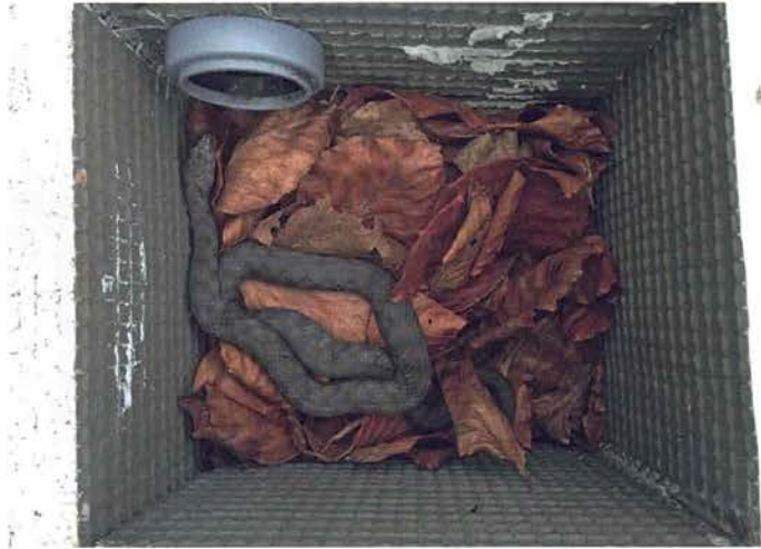
Abb. 7. Männliche Natrix tessellata in der Häutung.

Nachdem die Würfelnattern im Oktober eines jeden Jahres in das Zimmerterrarium überführt werden, biete ich ihnen noch zweimal Futter an, damit ich die Konsistenz des Kots überprüfen und gegebenenfalls eine Kotprobe in ein Labor einschicken kann. Danach lasse ich die Tiere noch zwei bis drei Wochen ohne Futtergaben auf „Betriebstemperatur“. Anschließend beginne ich schrittweise, die Temperatur auf 8–10 °C abzusenken. Ende Februar des Folgejahres fahre ich die Temperaturen schrittweise hoch. Sobald meine Würfelnattern wieder aktiv sind, beginnen sie mit der Nahrungs-