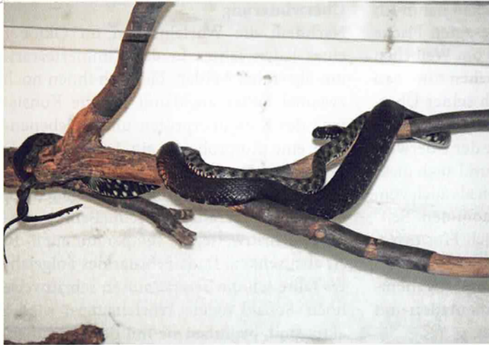
Abb. 9. Würfelnatternpaarung im Geäst.