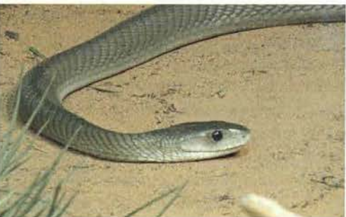
Abb. 51. Dendroaspis polylepis , Porträt.