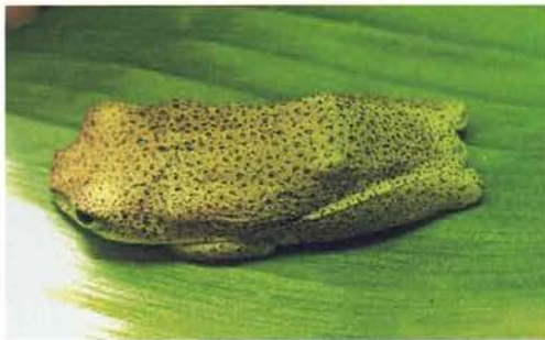
Abb. 39. Hyperolius nitidulus .