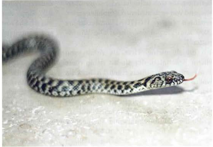
Abb. 4. Juvenile Würfelnatter der flavescens -Variante.

Wege in das große Wasserbecken. Setze ich mich dann auf eine Bank in der Nähe des Terrariums und warte etwa 10–15 Minuten, kommen sie meist wieder hervor. Interessanterweise ist das Männchen im Zimmerterrarium „zutruulicher“ als das Weibchen und im Freilandterrarium scheuer als dieses. Oft reicht schon eine Fußbewegung, um es zu einer erneuten Flucht zu veranlassen. Direkt neben der Sitzbank befindet sich ein Fenster in der Hauswand, durch das sich die Würfelnattern problemlos beobachten lassen, obwohl es nur etwa anderthalb Meter vom Terrarium entfernt ist.