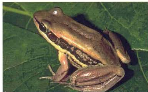
Abb. 17. Hylarana galamensis .