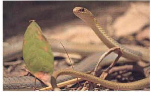
Abb. 63. Psammophis lineatus .