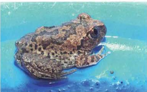
Abb. 85. Leptopelis bufonides .