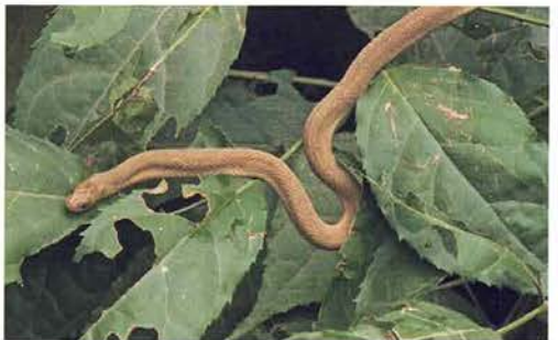
Abb. 61. Dasypeltis gansi .