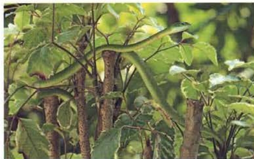
Abb. 102. Philothamnus irregularis .