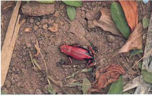
Abb. 22. Phrynomantis microps , Weibchen.

auch wehrhaftere Bodenschlangen müssen nach Niederschlägen ihre unterirdischen Behausungen verlassen. Amblyodipsas unicolor (Abb. 32 & 33), eine Erdvipere, ist so ein Beispiel, von dem man tunlichst die Hände lassen sollte, da diese Schlange ihre langen Giftzähne seitlich aus dem Maul schieben und durch ein Kopfschütteln auch schnell in die Finger des Fängers schlagen kann, während dieser das Tier vermeintlich sicher zu halten wähnt. Der so generierte Schmerz erinnert am ehesten an einen Stromschlag, der anhält.