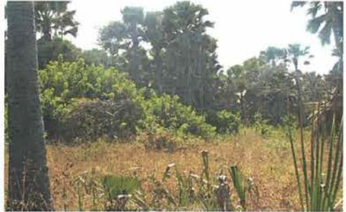
Abb. 7. Cashewsträucher in der Savanne vor dem Trockenwald (Bijilo-Forest).