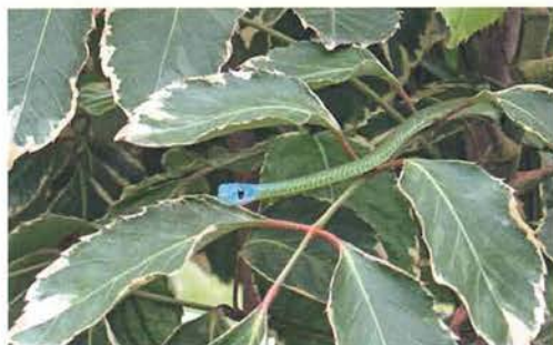
Abb. 101. Philothamnus semivariatus .