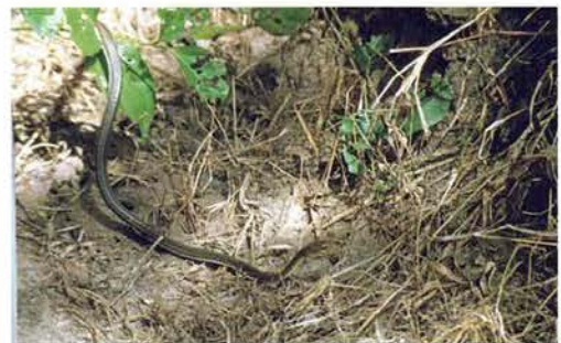
Abb. 66. Psammophis sibilans .