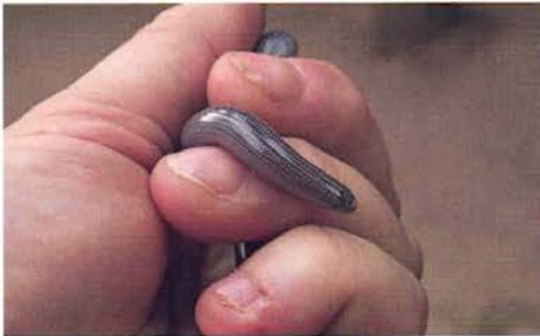
Abb. 27. Afrotrophlops punctatus , Porträt.