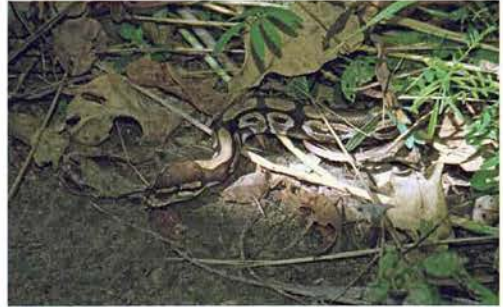
Abb. 87. Python regius .