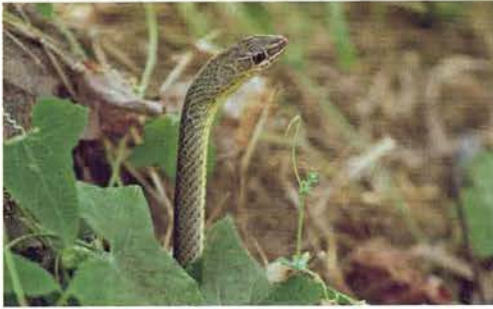
Abb. 67. Psammophis sibilans , Porträt.