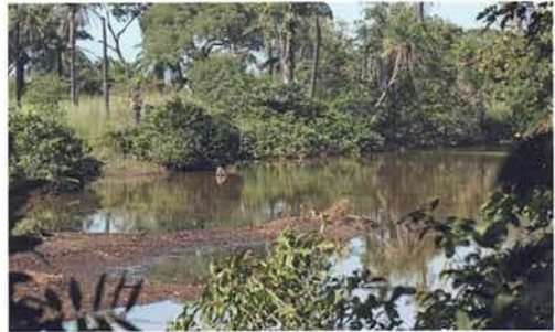
Abb. 77. Marakissa am Allahein-Fluss.