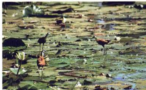
Abb. 15. Wasserstelle in Kotu.