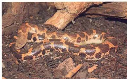
Abb. 12. Eryx muelleri .