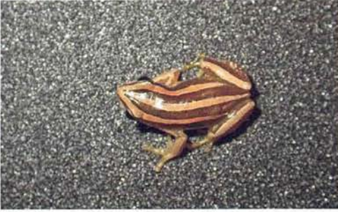
Abb. 82. Afrixalus vittiger .