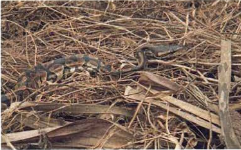
Abb. 25. Juveniler Königspython, Python regius .