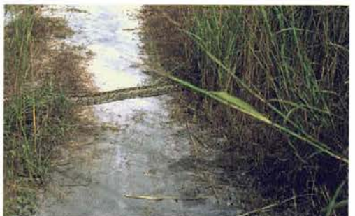
Abb. 55. Python sebae .