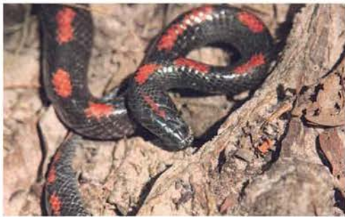
Abb. 42. Lycophidion albomaculatum , Porträt.