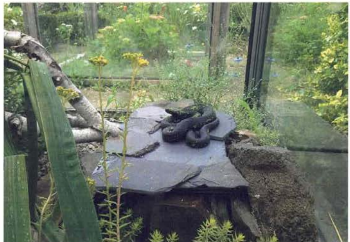
Abb. 8. Melanistisches Natrix-tessellata -Weibchen an seinem bevorzugten Sonnenplatz.