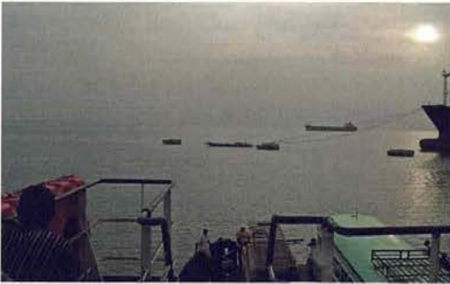
Abb. 49. Fähre mit Reisebus.