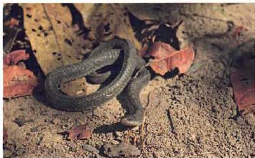
Abb. 35. Elapsoidea semiannulata moebiusi in Häutung.