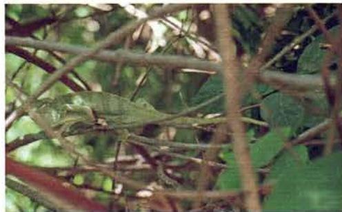
Abb. 14. Chamaeleo senegalensis .