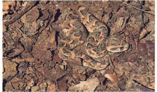
Abb. 96. Bitis arietans arietans .