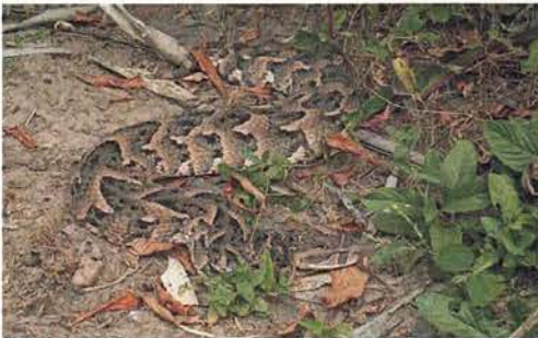
Abb. 93. Bitis arietans arietans .