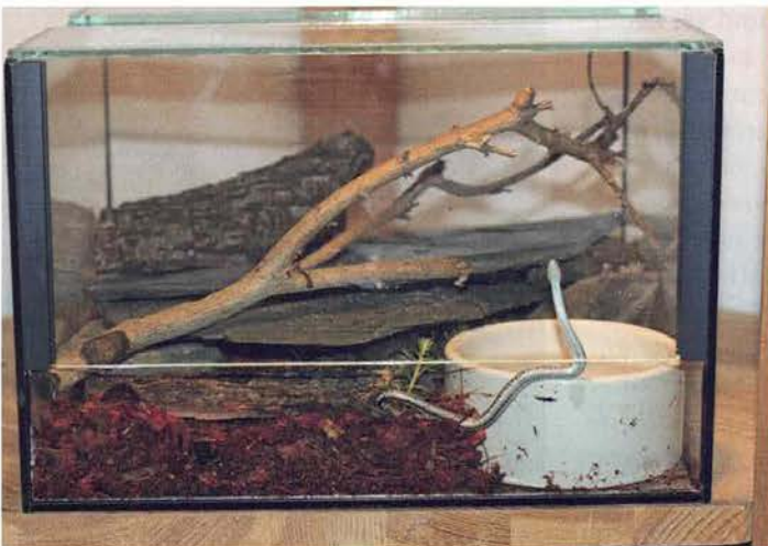
Abb. 3. Juvenile Natrix tessellata im Aufzuchtterrarium.