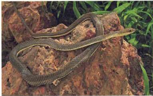
Abb. 69. Psammophis sibilans .