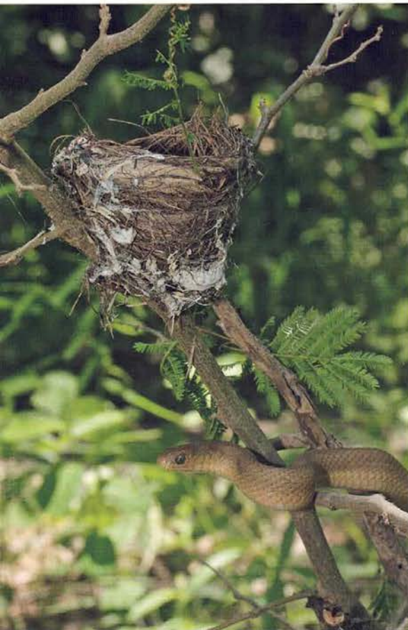
Abb. 62. Dasypeltis gansi , Porträt.

Im Geäst eines der Bäume konnte noch eine Eierschlange ( Dasypeltis sahelensis ) ausgemacht werden (Abb. 57). Weiter ging die Fahrt dann dem 17-Uhr-Tee entgegen.