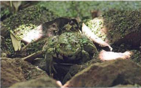
Abb. 84. Hoplobatrachus occipitalis .